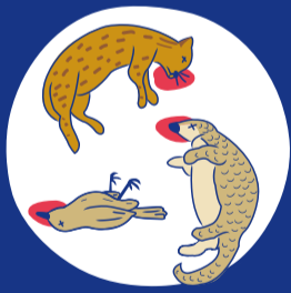
野生動物誤食後死亡